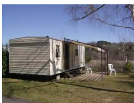
MH avec tonnelle

Inventaire : Une liste d'inventaire vous sera remise à votre arrivée. Vous aurez jusqu'au soir pour nous signaler tout manquement ou dégât constaté. Passé ce délai, nous considérerons que l'hébergement vous a été confié complet