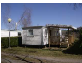
Mobil home avec terrasse bois