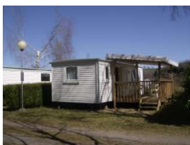
Mobil home avec terrasse bois