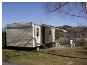
MH avec tonnelle

Vous pouvez souscrire à une assurance annulation de séjour (2,7 % du coût du séjour), il faut nous contacter afin de vous préciser les modalités. (CampezCouvert) Caution : Un dépôt de garantie de 200€ (dont 20 € pour le badge-barrière) sera demandé à votre arrivée afin de couvrir les éventuels dégâts du locatif, ainsi qu'un dépôt de garantie supplémentaire de 50 € pour garantir l'état de propreté au moment de votre départ. Ceux-ci vous seront restitués après un état des lieux du locatif. Il sera fait une déduction des frais de remise en état des lieux et/ou de la valeur du matériel manquant ou détérioré. Les dépôts de garantie seront doublés en présence d'un animal. Il est interdit de fumer dans la location et de jeter les mégots dehors. Inventaire : Une liste d'inventaire vous sera remise à votre arrivée. Vous aurez jusqu'au soir pour nous signaler tout manquement ou dégât constaté. Passé ce délai, nous considérerons que l'hébergement vous a été confié complet