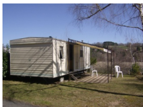
MH avec tonnelle

Inventaire : Une liste d'inventaire vous sera remise à votre arrivée. Vous aurez jusqu'au soir pour nous signaler tout manquement ou dégât constaté. Passé ce délai, nous considérerons que l'hébergement vous a été confié complet