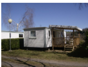
Mobil home avec terrasse bois